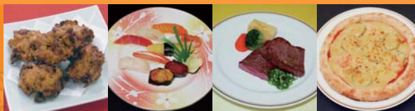
弘前いがめんち 握り寿司 牛サーロインのグリル ミックスピザ